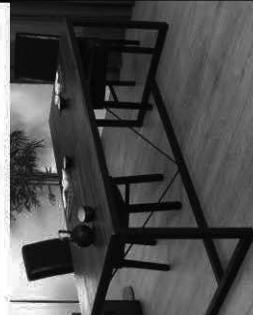
TABLE À DÎNER EDENA