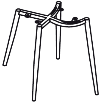
B x 1