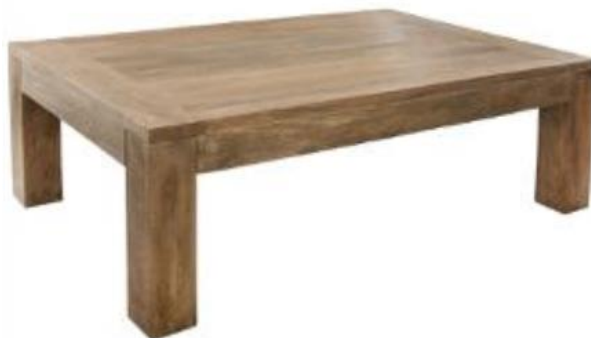
Table basse • Coffee table Mesa de centro • Mesa baja • Niedriger Tisch Lage tafel • Tavolino baso • Кофейный столик

IMPORTANT: a conserver pour consultation ultérieure: à lire attentivement. IMPORTANT: retain for future reference, read carefully WICHTIGE: informationen, aufmerksam durchlesen und aufbewahren. IMPORTANTE: guardar esta informacion para futuras referencias, leer atentamente. IMPORTANTE: informação a conservar, ler atentamente. IMPORTANTI informazioni, conservare per futura consultazione, leggere con attenzione. BELANGRIJKE informatie, bewaren voor toekomstig gebruik, zorgvuldig lezen. ВАЖНАЯ информация, сохранять для использования в дальнейшем, внимательно прочесть.